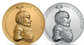
Władysław Łokietek (1320–1333) Emisja: 13 IX 2013 r.