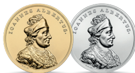
Jan Olbracht (1492–1501) Emisja: 14 VI 2016 r.