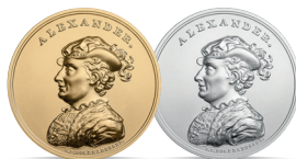
Aleksander Jagiellończyk (1501–1506) Emisja: 7 XII 2016 r.