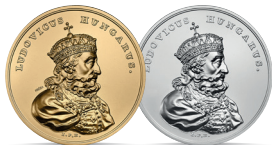
Ludwik Węgierski (1370–1382) Emisja: 10 IX 2014 r.