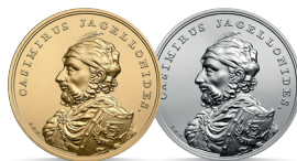
Kazimierz Jagiellończyk (1447–1492) Emisja: 3 XII 2015 r.