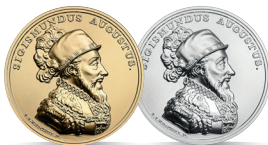
Zygmunt August (1548–1572) Emisja: 7 XII 2017 r.