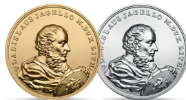
Władysław Jagiełło (1386–1434) Emisja: 3 III 2015 r.