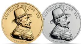
Zygmunt III Waza (1587–1632) Emisja: 23 I 2020 r.