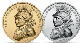
Władysław Warneńczyk (1434–1444) Emisja: 15 IX 2015 r.