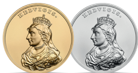
Jadwiga Andegaweńska (1384–1399) Emisja: 4 XII 2014 r.