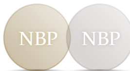
Stanisław August Poniatowski (1764–1795) Projekt monety w przygotowaniu