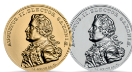
August II Mocny (1697–1706, 1709–1733) Emisja: 1 XII 2022 r.