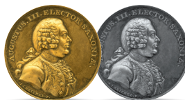
August III Sas (1733–1763)