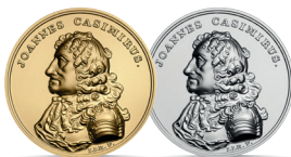
Jan Kazimierz Waza (1648–1668) Emisja: 26 I 2021 r.