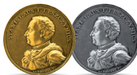
Stanisław Leszczyński (1705–1709, 1733–1736)