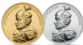
Stefan Batory (1576–1586) Emisja: 17 I 2019 r.