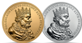
Bolesław Chrobry (992–1025) Emisja: 12 III 2013 r.