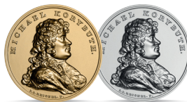
Michał Korybut Wiśniowiecki (1669–1673) Emisja: 2 XII 2021 r.