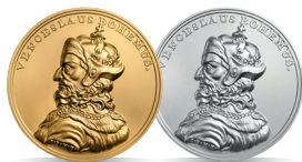
Wacław II Czeski (1291–1305) Emisja: 22 V 2013 r.