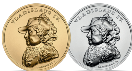
Władysław IV Waza (1632–1648) Emisja: 3 XII 2020 r.