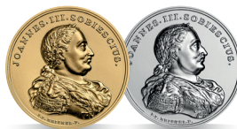
Jan III Sobieski (1674–1696) Emisja: 9 II 2022 r.