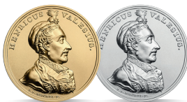
Henryk Walezy (1573–1575) Emisja: 12 VII 2018 r.