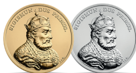
Zygmunt I Stary (1506–1548) Emisja: 12 VII 2017 r.