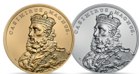
Kazimierz Wielki (1333–1370) Emisja: 3 III 2014 r.